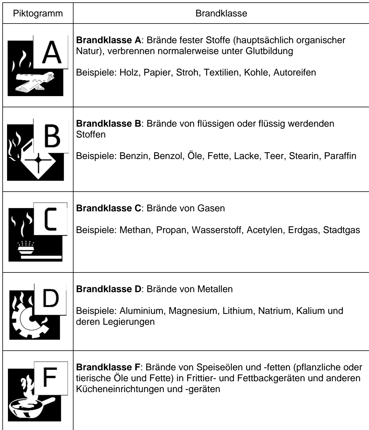
Tabelle 1: Brandklassen nach DIN EN 2 „Brandklassen“ Ausgabe Januar 2005